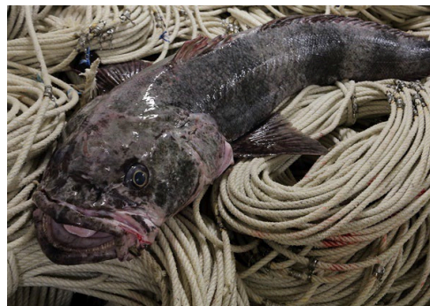
マジェランアイナメ