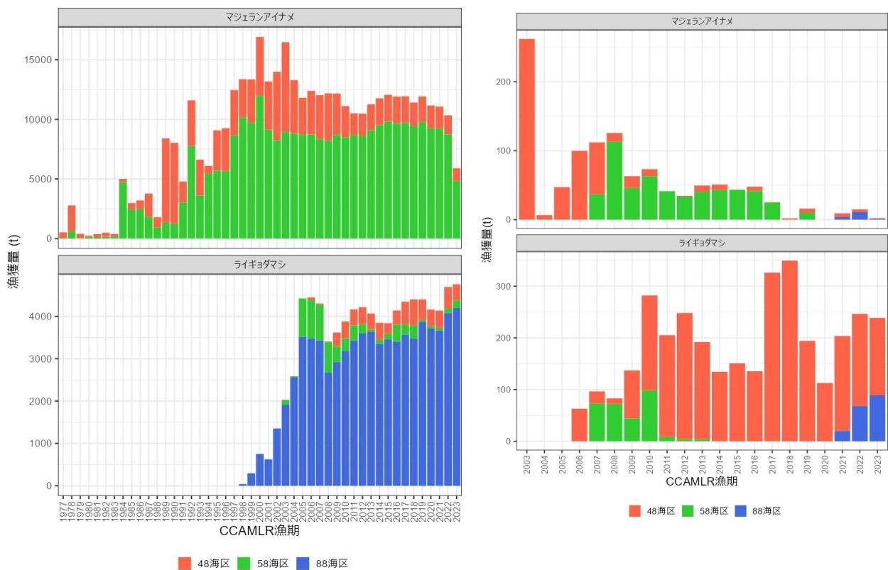
CCAMLR 水域におけるマジェランアイナメとライギョダマシの漁獲量の海域別の推移 (1977~2023 年)

CCAMLR 漁期は CCAMLR で用いられている漁期の年度を示し、単位年度は 12 月 1 日~翌 11 月 30 日である。