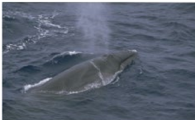
浮上直後のイワシクジラ