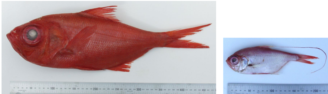
キンメダイ (左：成魚、右：“イトヒキンメ”と呼ばれる当歳魚)