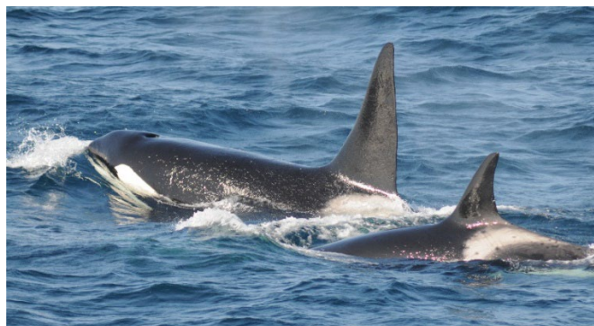
シャチの群れ 雄の背鰭は直立して高い