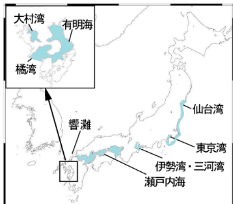
日本におけるスナメリの主分布域 仙台湾～東京湾、伊勢湾・三河湾、瀬戸内海～響灘、大村湾、有明海・橘湾

* 東日本大震災による生息環境への影響が懸念される仙台湾から房総半島東岸にかけての海域及び資源量推定値の小さい大村湾では要注意。