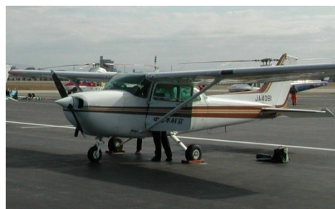
航空目視調査に使用される小型固定翼機