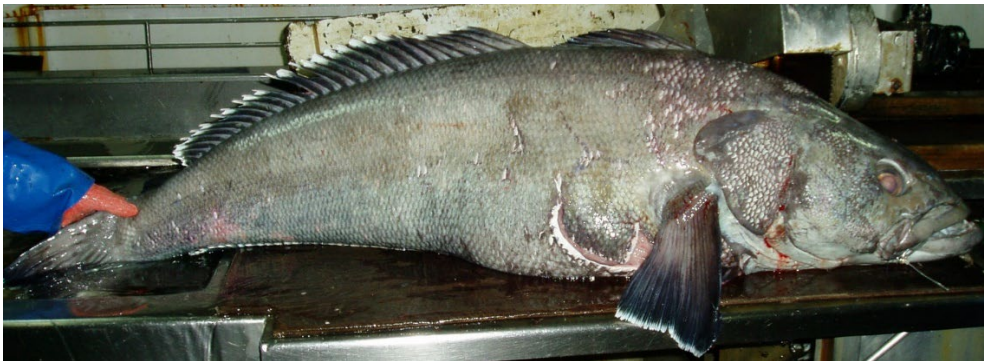
マジェランアイナメ

(Patagonian Toothfish Dissostichus eleginoides )