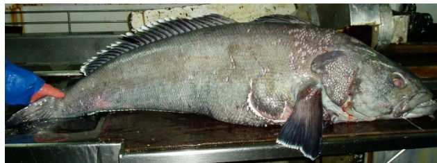
マジェランアイナメ (C) TAIYO A & F CO., LTD.

Patagonian Toothfish Dissostichus eleginoides