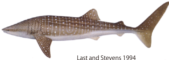
Last and Stevens 1994

管理・関係機関 中西部太平洋まぐろ類委員会 (WCPFC) 全米熱帯まぐろ類委員会 (IATTC) インド洋まぐろ類委員会 (IOTC) 絶滅のおそれのある野生動植物の種の国際取引に関する条約 (ワシントン条約、CITES)