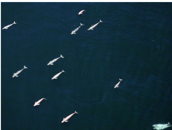
航空機から見たスナメリ