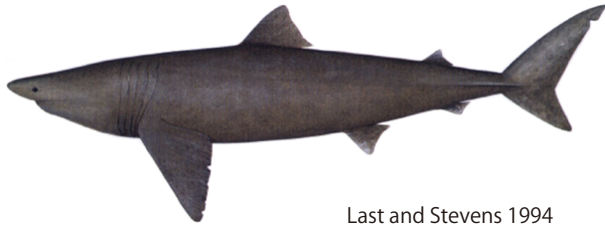
Last and Stevens 1994