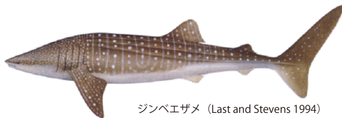
ジンベエザメ (Last and Stevens 1994)