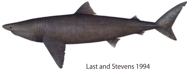
Last and Stevens 1994

管理・関係機関 国際連合食糧農業機関 (FAO) 絶滅のおそれのある野生動植物の種の国際取引に関する条約 (ワシントン条約、CITES)