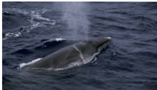
図 1. 浮上直後のイワシクジラ