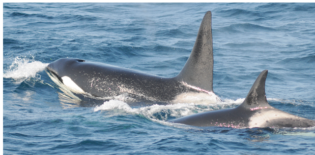
図 1. シャチの群れ 雄の背鰭は直立して高い。