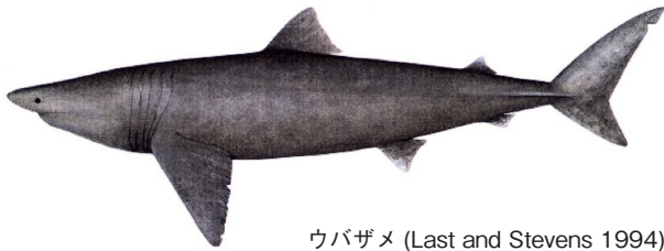
ウバザメ (Last and Stevens 1994)

管理・関係機関 絶滅のおそれのある野生動植物の種の国際取引に関する条約 (ワシントン条約, CITES)