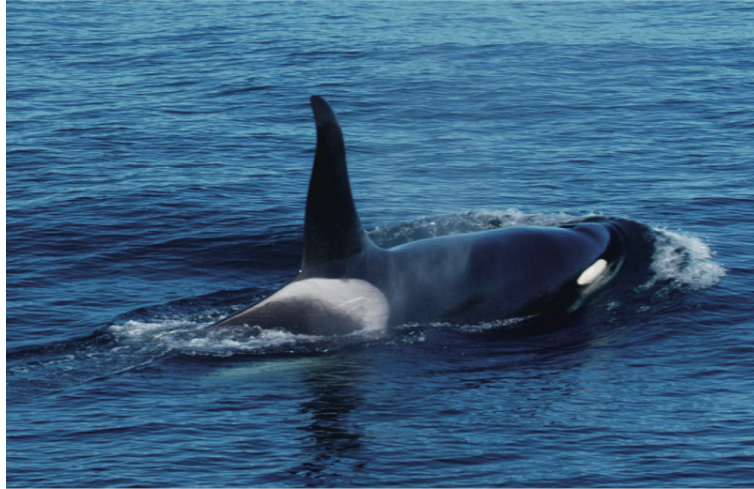
図 1. 成熟した雄のシャチ